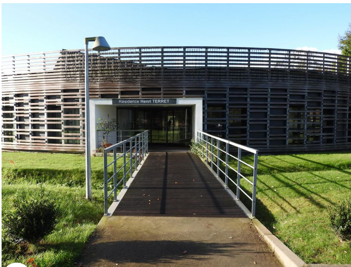
Image 1 sur 5 Résidence Henri Terret

*Agence Nationale de l'évaluation et de la qualité des établissements et services sociaux et médico-sociaux